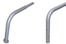
Skjøterør 37,5° ytre/indre Skjøterørene skal monteres med låsesplint 12 mm