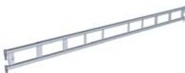
Lengdebjelke LB Med fjærlås