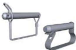
Låsesplint Diameter 12 mm resp. 16 mm