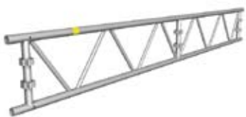
Fagverksbjelke 450 AL m. bøyer L=2220, 4100, 6100 resp. 8100 mm. Med bøyer på vertikaler og hull i det øvre røret for skinnfestene

Med fagverksbjelke også i veggen og HAKI Trak duk hele veien, får man en smidig og rask løsning for den enkle hallen. Bruk med fordel den rimelige HAKITEC duken med kjederlist. Leves på rull og kappes i forbindelse med monteringen i riktig lengde.