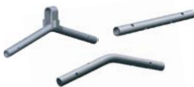
Skjøterør 450 Skjøterørene skal monteres med 4 stk låsesplinter 12 mm pr skjøterør.